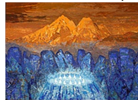
QUADRO DE VLADIMIR BOREGAR

Diretoria Executiva